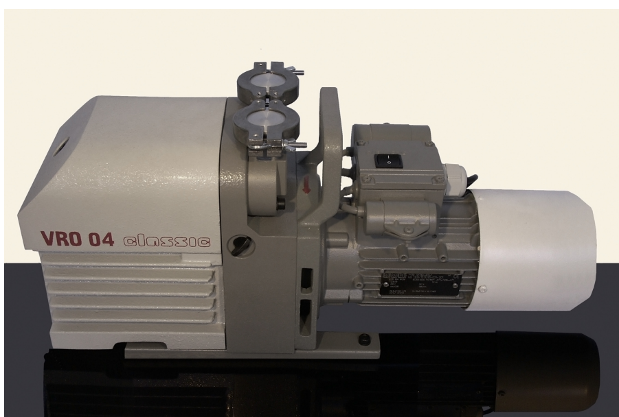
VÝVĚVA ROTAČNÍ OLEJOVÁ