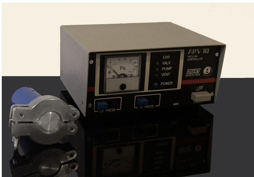
ARV 10 P